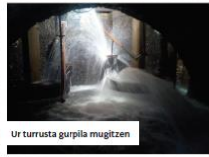
Ur turrusta gurpila mugitzen