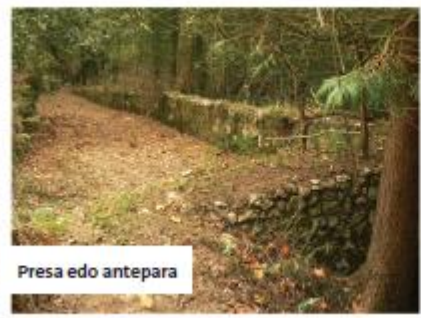
Presa edo antepara